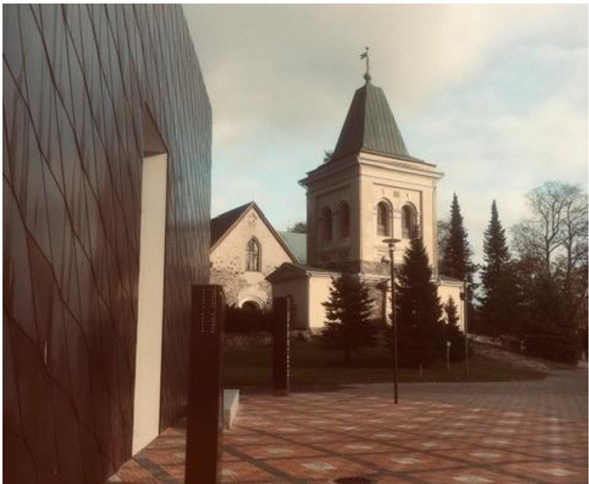
Pyhän Mikaelin kirkko syksyllä 2020